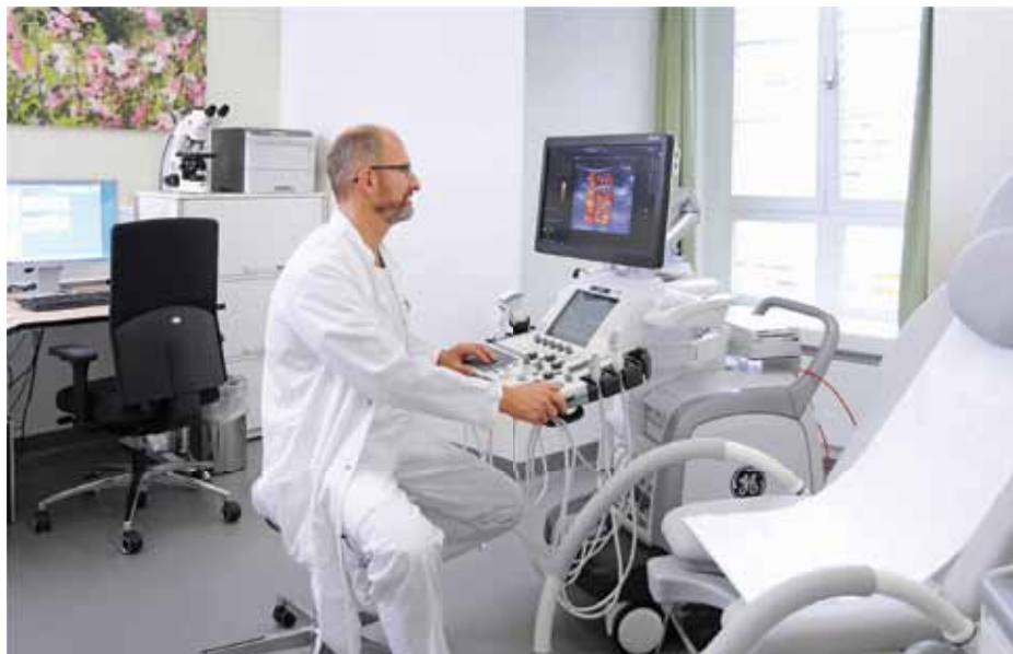
Einblick in die neu gestalteten Untersuchungsräume